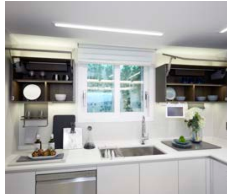
상부 유리도어 전동 플랩장, 상부장 하부조명