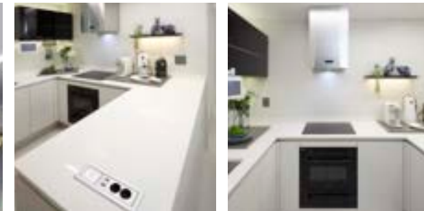
유럽산 대형포셀린타일 주방벽, 엔지니어드스톤 주방상판, 무선충전 콘센트