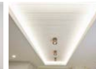
주방 우물천장 및 간접조명