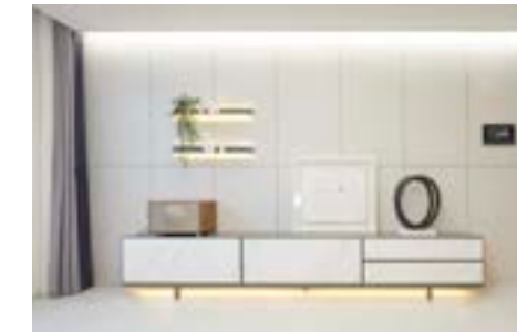
유럽산 대형 포셀린타일