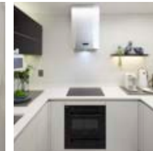
독립형 후드, 하이브리드쿠킹