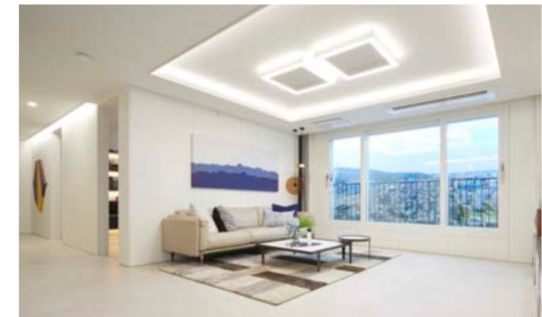
거실 우물천장 내 간접조명, 리니어 조명, 픽처레일, 시트패널